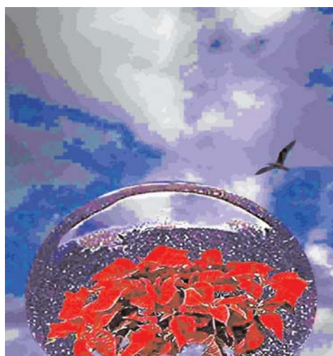
“Stelle di Natale” (Omaggio a Magritte)

Foto ed elaborazione grafica di Gian Foresi