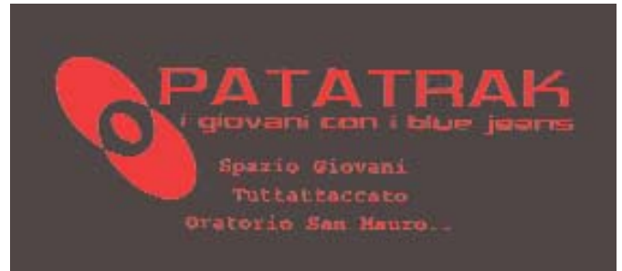
Il Logo di Patatrak

C' era una volta in quel di Bernareggio una dolce apatia, dove regnava un magnifico immobilismo e nessuno si sognava di sconfinare dal suo orticello. A un certo punto, un famigerato consigliere di corte e quel brutto ceffo del re in persona, decisero di rovinare questa idilliaca situazione con una screanzata idea: perché non stravolgere la vita dei sudditi creando situazioni per incontrarsi, confrontarsi e condividere iniziative ed eventi? Voi penserete che di certo non avrà avuto seguito questo strampalato pensiero e invece, quei manigoldi di Spazio Giovani e seguendo a ruota quei scellerati e truffaldini del Gruppo Musica, dell'ass. Tuttoattaccato, dell'Oratorio, della Biblioteca, ... PATATRAK !!!! E si ruppe per sempre quella splendida noia che ci avvolgeva teneramente. Piaciuta la favola? È quello che nel nostro piccolo stiamo portando avanti da qualche mese ed ha già prodotto l'incontro di tutti i protagonisti sopraccitati (cosa non da poco) e un'iniziativa come "cinematografo 2004" che supera ormai le quaranta presenze a proiezione (e siamo solo al terzo film). Inoltre è in programma una due giorni di musica e festa al CTL3 che si terrà sabato e domenica 26 e 27 giugno e vedrà una rassegna musicale di giovani