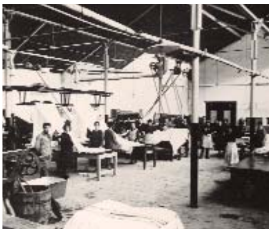
Antica tessitura