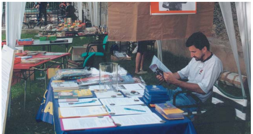
Expo 2000: il gazebo di Amnesty International

Sabato 30 giugno: Concerto di giovani artisti (giardini comunali di Bernareggio), Jam session di percussioni, Concerto dei Rakasta: tributo a Bob