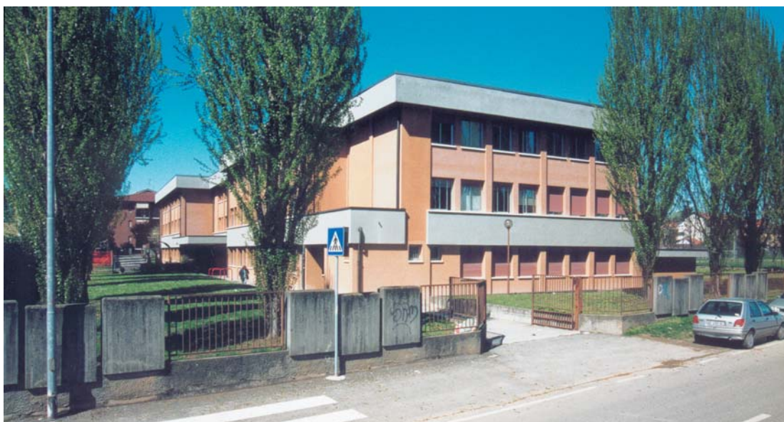
L'ingresso della Biblioteca, in via Pertini (Scuola Media)