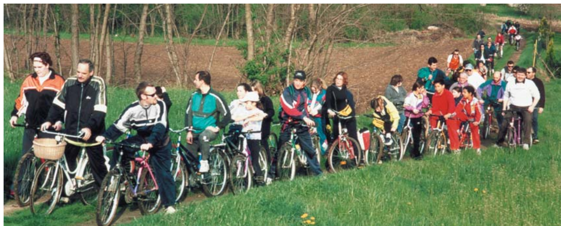
A sinistra un momento della manifestazione