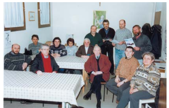
Il direttivo AVIS di Bernareggio

L'indirizzo di posta elettronica è: avis.bernareggio@jumpy.it